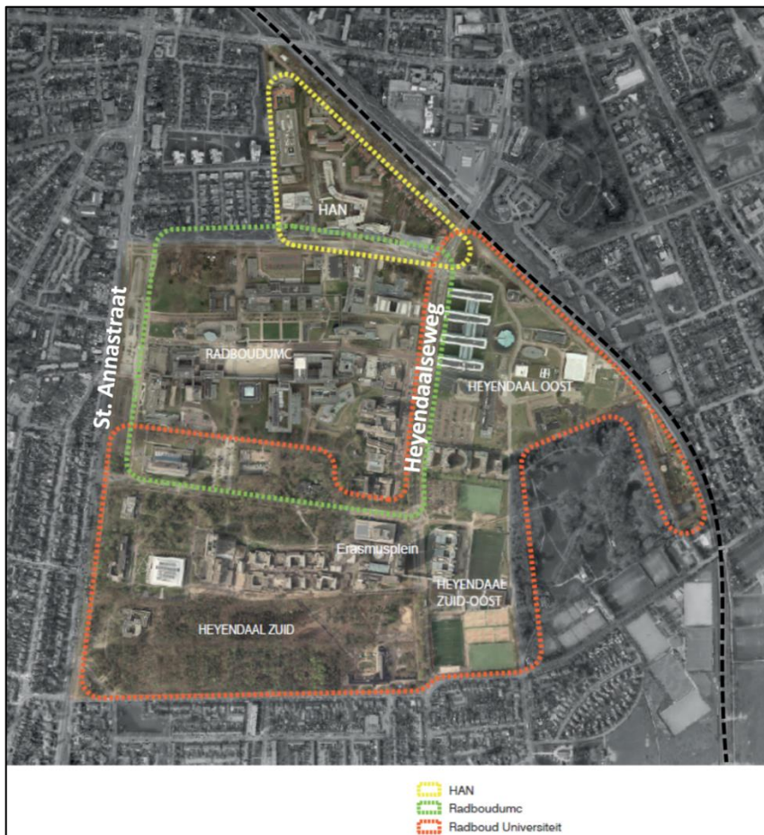
Afbeelding 1: Plangebied Campus Heijendaal

Er is veel overlap en gezamenlijkheid in de wensen van de campuspartners en de gemeente. De partijen delen bovenstaande ambities voor de ontwikkeling van het gebied, alleen betekent dat nog niet dat al deze ambities volledig kunnen worden gerealiseerd